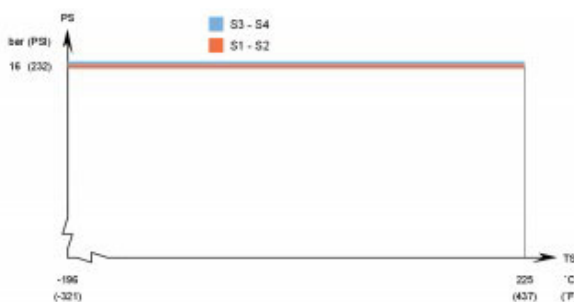
CB20/CBH20 - PED godkännandetryck/temperaturkurva